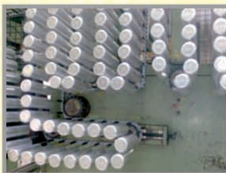
Chaînes CAN pour aérosol